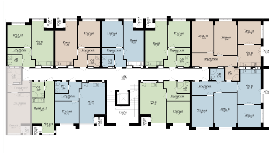
Розташування на генплані